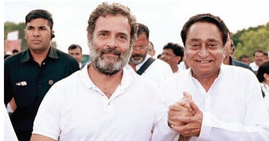
visit the birth place of Dr. Bhimrao Ambedkar, the architect of the constitution.

Bharat Jodo Yatra will enter the state from Burhanpur on November 20. Apart from Burhanpur, this journey will pass through Khandwa, Khargone, Indore, Ujjain and Agar Malwa. During these 13 days' stay, where Rahul Gandhi will bathe and worship in the Narmada river, Mahakal of Ujjain is going to visit the Jyotirlinga, not only that, he will also visit the Omkareshwar Jyotirlinga in Khandwa. Apart from this, apart from tribal hero Tantya Bhil, there is also a program to